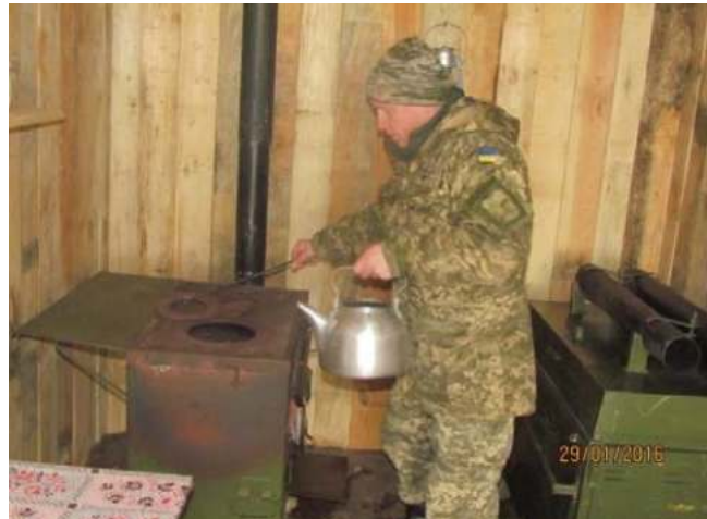
Рис. 4. Пункт харчування ВОП