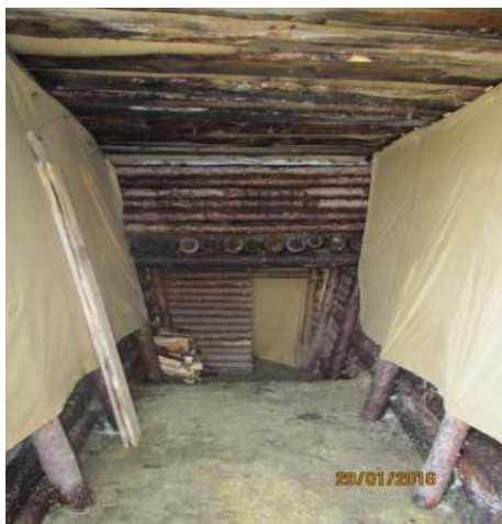
Рис. 3. Пункт харчування РОП

В залежності від побудови оборони військової частини (підрозділу), інтенсивності бойових дій і масштабів застосування противником різних видів озброєння і інших факторів, які впливають на організацію продовольчого забезпечення підрозділів, за рішенням командира батальйону з обов'язковим погодженням із заступником командира військової частини з тилу, харчування особового складу здійснюється безпосередньо на ротних (взводних) опорних пунктах, де розгортаються пункти харчування ротних (взводних) опорних пунктів (рис. 3, 4).