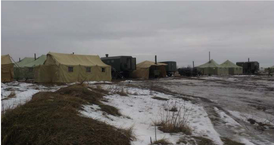
Рис. 1. Розміщення ППБ на місцевості

Харчування особового складу батальйонів, здійснюється через продовольчі пункти батальйонів, які розгортаються на місцевості (рис. 1), силами і засобами господарчих відділень взводів матеріального забезпечення батальйонів для приймання і зберігання батальйонних запасів продовольства, доставки і видавання його підрозділам та приготування гарячої їжі, а також через пункти харчування ротних опорних пунктів (РОП) і взводних опорних пунктів (ВОП).